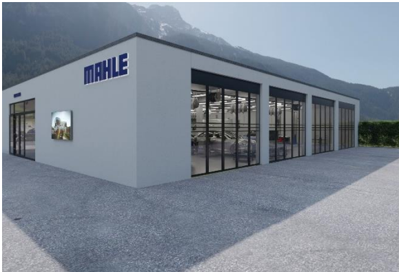
Rund um die Uhr geöffnet – die neue virtuelle Werkstatt von MAHLE Aftermarket.