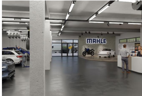
Ein großzügiger Eingangs- und Informationsbereich lädt Besucher und Besucherinnen in die Produktwelt von MAHLE Aftermarket ein.