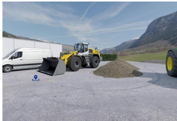
Nutzfahrzeuge, Bau- und Landmaschinen finden Besucher und Besucherinnen im Außenbereich.